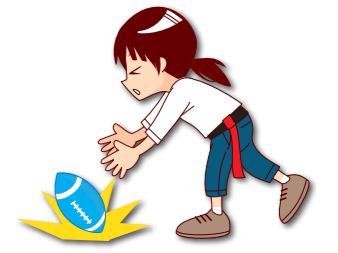
ボールを落とした