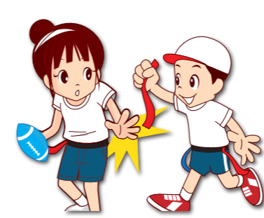
フラッグをとられた

ボールを持った人が、フラッグをとられたり、横の線から出たり、ボールを落とした地点のゾーンの得点が入る。